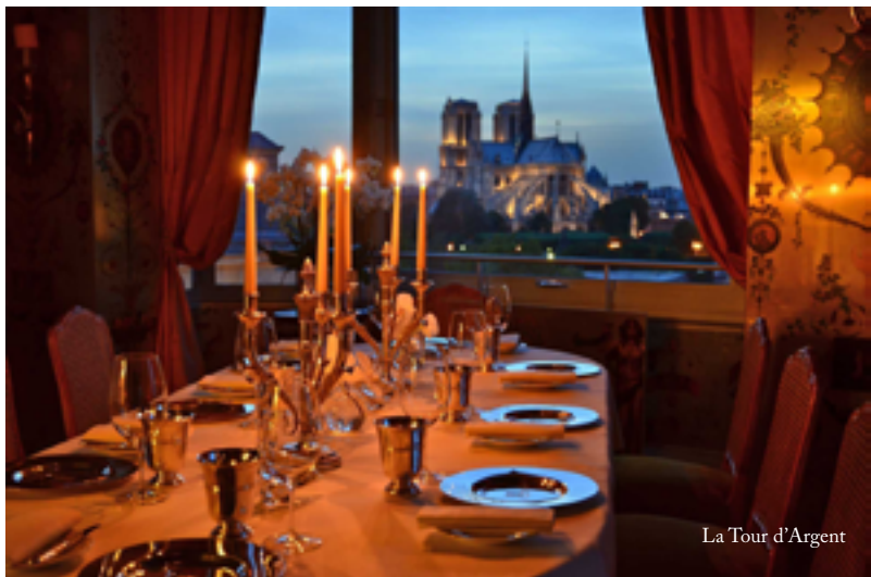
La Tour d'Argent

Aussi arrange-t-il un rendez-vous entre eux et Tcholac-Anticz , sous le prétexte de lui faire rencontrer des amis français qui pourraient l'aider et l'accueillir. Le rendez-vous est pris dans un restaurant huppé ( la Tour d'Argent ou bien au Benkay, restaurant japonais sur le quai de Grenelle, par exemple) de la capitale et l'accueil doit avoir lieu dans le parking souterrain. Malheureusement, ils ne seront pas les seuls à attendre et si les joueurs n'ont pas pris de précautions, ils seront surpris de voir apparaître un commando de cinq hommes qui ouvriront le feu sans autre forme de présentations, dès l'arrivée de la voiture de Tcholac-Anticz. Ils prendront pour cible la voiture bien évidemment mais les joueurs également. Dans la fusillade qui s'en suivra, ceux-ci pourront peut-être blesser un, voire plusieurs de leurs adversaires et tenter de le capturer pour le faire parler plus tard. Mais dans tous les cas de figure, ils n'ont pas intérêt à s'attarder s'ils veulent éviter d'avoir affaire à la justice des hommes car, très rapidement, les brigades spécialisées de la police seront sur les lieux et boucleront le quartier. Le chauffeur de Tcholac-Anticz, lui, n'a de toute façon pas demandé son reste et est parti avec son passager dès les premiers coups de feu.